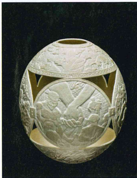
Gil Batle, Romeo & Juliet II , 2015.

Côté contemporain, il va falloir fourbir ses armes si ce n'est pas déjà fait ! La semaine s'annonce intense, avec en premier lieu la FIAC. Si elle a perdu son (off)icielle, celle-ci a gagné au Petit Palais un secteur « On Site ». Et si du côté des « off » de la foire, on regrette la disparition temporaire de Slick Art Fair, le programme reste nourri avec YIA Art Fair, Art Élysées, Asia Now ou encore Outsider Art Fair. Cette dernière manifestation va fêter sa quatrième édition parisienne du 20 au 23 octobre à l'hôtel du Duc, pas très loin de Drouot, au 22 de la rue de la Michodière, dans le II e arrondissement. Cette « boutique fair » est née à New York, où elle fêtera son 25 e anniversaire en janvier prochain.