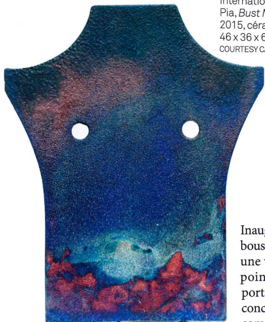
Ci-contre À Paris Internationale, Camil Pia, Bust Mask Blue , 2015, céramique, 46 x 36 x 6 cm COURTESY CAMIL PIA.